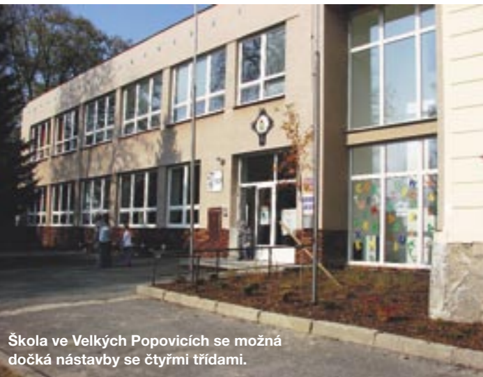
Škola ve Velkých Popovicích se možná dočká nástavby se čtyřmi třídami.

dotat, že některé obce, kde školy nemají a ze zákona mají povinnost zajistit svým občanům školní docházku, situaci příliš neřeší. Jejich občané tak absolvují zápisy v různých školách, s tím, že třeba budou mít někde štěstí. Na druhou stranu každý má právo vybrat si školu a vím, že i někteří z Mnichovických se budou hlásit jinam. To nám nesmírně zkomplikuje rozhodování, proto bych poprosila rodiče, kteří již budou mít verdikt o přijetí, aby informovali ostatní školy, kde mají přihlášku, a tak uvolnili místo pro jiné žáčky. Mluví se i tom, že v kraji nouzi se bude učit „na směny“. Je to vůbec možné?