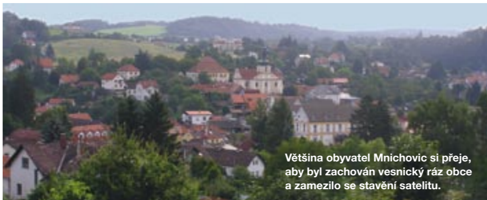
Většina obyvatel Mnichovic si přeje, aby byl zachován vesnický ráz obce a zamezilo se stavění satelitu.

ÚP počítá s tím, že Farská louka bude upravena na velký městský park vhodný pro relaxaci, setkávání lidí a samozřejmě s herními prvky pro děti. Dále chceme obnovit rybníky. Objevíli jsem mapu rybníku Koloděj z 18. století (nad tenisovými kurty) a také plánujeme obnovit i Halašův rybník v centru Mnichovic. ÚP pamatuje i na stezky pro pěší, maminky s kočárky a samozřejmě cyklisty. Nejdelší z nich začíná pod Klokočnou, vede k Zittovu mlýnu, odtud pod Budíkovem přes Farskou louku k Obecníku, podél potoka Křiváčku do Podhorek, nahoru ke Káčce až do Jídašek. Plánů a vizí, jak Mnichovice zvelebit, obsahuje nový územní plán mnoho. Jejich realizace se bude samozřejmě odvíjet podle finanční situace, ale „zdravý“ směr vývoje již bude napevno určen.