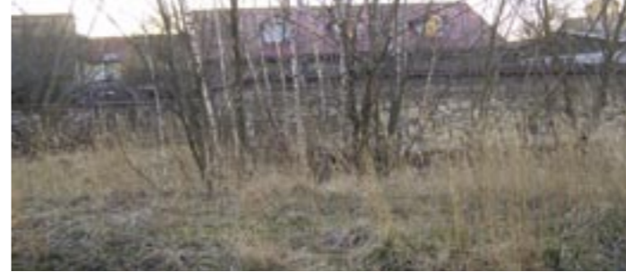
Prostranství v areálu školy před úpravou

mlýny je ve srovnání s prosazením dětského hřiště procházka růžovým sadem. Nakonec se dobrá věc podařila a školní dvůr se od té doby změnil k nepoznání - je zde upravené prostranství, skleník, trampolína, altány a dětské hřiště. Poděkování patří všem dárcům, podporovatelům a dobrovolníkům a také firmě Baxter, která poskytla nejen peněžní dar, ale i své zaměstnance, kteří pomáhali hřiště budovat.“