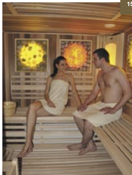
Procedury si můžete objednat pro 1 až 2 osoby nebo pro větší skupinu přátel. Vždy máte zajištěno soukromí.

Himalájská solná sauna je ve svém principu úplnou novinkou na českém trhu. Ve srovnání s účinky klasické finské sauny zde navíc příznivě působí minerály a stopové prvky obsažené v soli, které se do těla dostanou přirozenou cestou. Himalájské solné sauny dobře snášejí lidé, kterým se v klasických saunách špatně dýchá. Důvodem