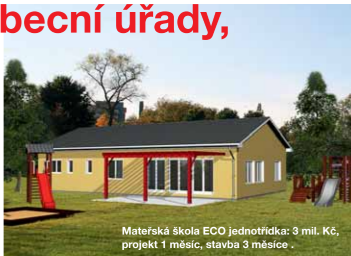
Mateřská škola ECO jednotřídka: 3 mil. Kč, projekt 1 měsíc, stavba 3 měsíce .

Nástavby a přístavby jsou často velmi efektivní cestou, jak v obci postavit novou komunální stavbu bez nutnosti mít k dispozici volnou parcelu na vhodném místě. S obcemi spolupracujeme i při zajištění dotací nebo úvěrů pro financování našich komunálních staveb. Stavby dodáváme celé na klíč: projekt, financování, realizaci, provoz.