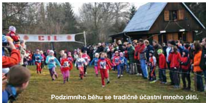
Podzimního běhu se tradičně účastní mnoho dětí.