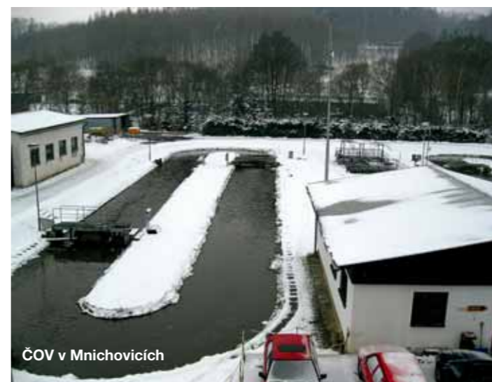
ČOV v Mnichovicích