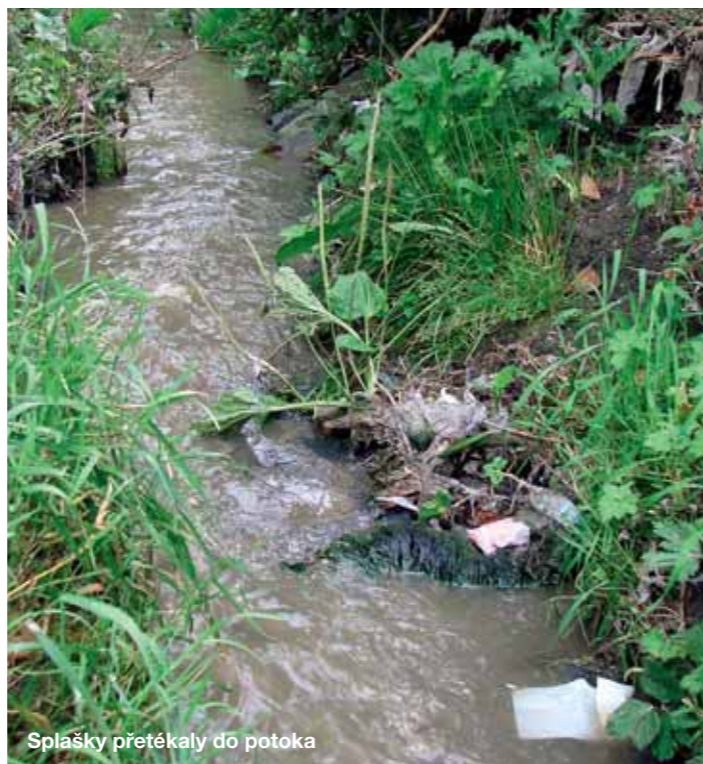
Splašky přetékaly do potoka

„Rekonstrukce odlehčovacích komor zajistí snížení počtu přeplnění odpadních vod do přírody při zachycení plovoucích nečistot a bude stát přes pět milionů korun. Provést ji bude společnost Porr, která uspěla v otevřené veřejné soutěži,“ říká radní a zastupitel města Miloslav Šmolík. Oproti cenám odhadovaných projektantem se tak podařilo ušetřit zhruba třetinu nákladů.