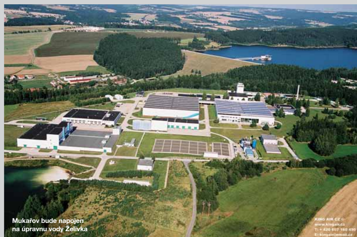
Mukařov bude napojen na úpravnu vody Želivka

vodovodu. Nová vodovodní síť bude napojena na přivaděč Region jih, který po kolaudaci II. etapy v loňském roce končí ve Svojeticích. Obec sdružená v Regionu jih se nyní připravují na III. etapu výstavby přivaděče, která se týká právě Srbína, Mukařova a Žernovky. V souladu s nyní podaným projektem se připravuje I. část III. etapy, kdy přivaděč povede ulicí Choceradská (od Svojetic k ulici Na Pískách). Takže nejprve dojde k vybudování vodovodu ve starší části Srbína. Pak se bude pokračovat dál k Požáru, přes ulici Na Moklině, až na Žernovku. Zde bude vodovodní dílo velkého rozsahu Region Jih, který do Mukařova přivede kvalitní vodu ze Želivky, končit. Předtím ale musíme získat stavební povolení na některé části stavby, vysoutěžít dodavatele stavby, uskutečnit výběr a zajištění technického a autorského dozoru, a splnit další podmínky, kterými je vázáno poskytnutí dotace a zahájení vlastní výstavby. Takže nejbližší uvažovaný termín prvních terénních prací je podzim 2013, pokud vše půjde hladce.“