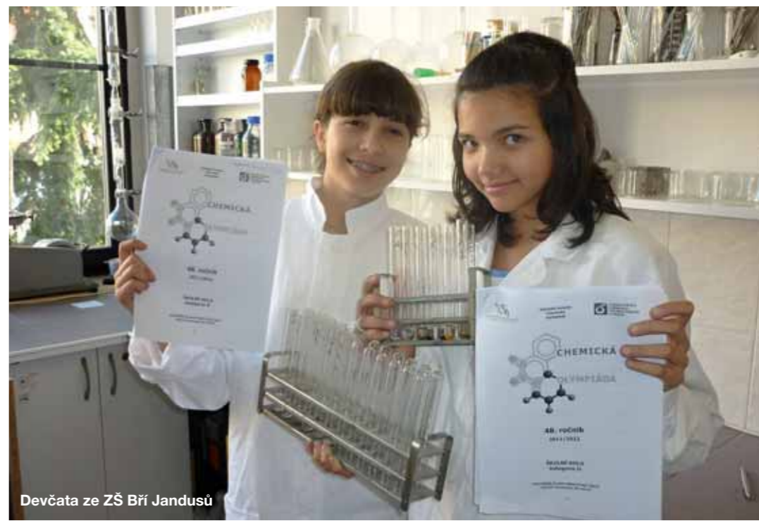
Děvčata ze ZŠ Bří Jandusů