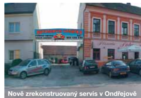
Nově zrekonstruovaný servis v Ondřejově

Autopůjčovna Půjčme vám tyto: Škoda Fabia Combi, Fabia Hatchback, Octavia II combi, Ford Escort a Tranzit. Diagnostika vozidel Diagnostiku provádíme ihned pro všechny koncernové vozy (Škoda, Audi, VW, Seat) novým přístrojem Bosch. Ostatní vozy vyšetříme také, ale na objednání. Autopůjčovna