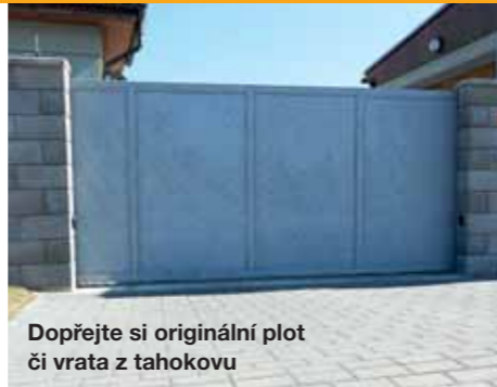
Dopřejte si originální plot či vrata z tahokovu

nými, plastovými nebo kovovými (kde lze volit mezi typizovanými profily, Tahokovem nebo kovanými prvky).