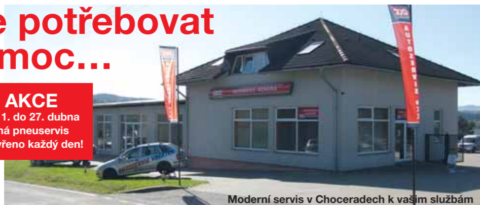
Moderní servis v Choceřech k vašim službám

AKCE Od 1. do 27. dubna má pneuservis otevřeno každý den!