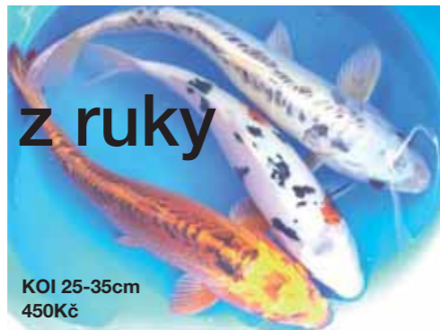
KOI 25-35cm 450Kč

Optimální podmínky pro chov Pokud se rozhodnete pro chov KOI kaprů, čeká vás nejprve hodně práce s vybudováním jezírka, které musí mít optimální podmínky. Musíte vybrat správné místo, zajistit kvalitní filtraci vody bez spoléhání jen na samočisticí efekt. A potom ryby správně ošetřovat a krmit. Základ tvoří ryby z Japonska K úspěšnému chovu je nezbytný i správný výběr ryb. Podle barvy, tvaru, původu. Základem našeho chovu je stále oživaný kmenový