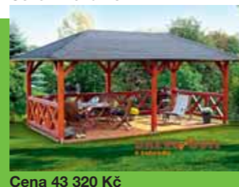
Cena 43 320 Kč