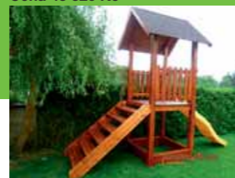
Cena 10 200 Kč

Internetový obchod www.drevoprodum.cz Kontaktní telefon: 606 076 736.