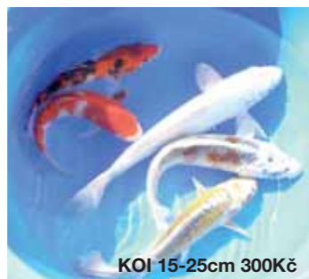
KOI 15-25cm 300Kč

Prodej bude zahájen od 15. dubna. Je nutné se předem objednat na tel.: 602 323 676 nebo e-mailem: info@zahradyprokoi.cz