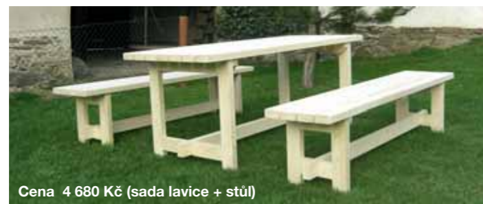
Cena 4 680 Kč (sada lavice + stůl)

konstrukce s. r. o., Sedlčany. A právě díky dlouholetým zkušenostem, profesionálnímu zázemí a moderním technologiím nabízí zákazníkům tu nejlepší kvalitu. „Používáme dobře vysušené a kvalitní dřevo, které poctivě, řemeslně zpracováváme. Konstrukce jsou vyrobené z masivních hranolů, jenž zaručují dobrou stabilitu a stoprocentní bezpečnost výrobků. Za své zboží ručíme a poskytujeme dvouletou záruku,“ vyzdvihuje pan Hořejší.