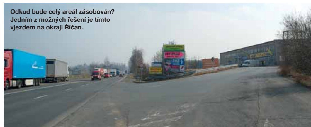
Odkud bude celý areál zásobován? Jedním z možných řešení je tímto vjezdem na okraji Říčan.

Jednání stále probíhají a město se samozřejmě snaží vyjednat takové podmínky, aby vyhovovaly přísnějšímu regulačnímu plánu, se kterým se počítá v novém územním plánu. Podle těchto podmínek by nové haly nesměly přesáhnout 4 000 m 2 zastavěné plochy, což investor původně zamýšlel a od svého záměru ustoupil. Dalším důležitým bodem, o kterém se jedná,