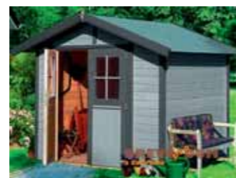
Cena 22 320 Kč