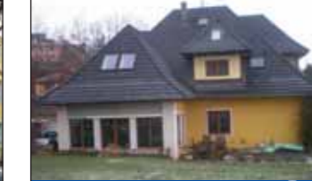
RD ČERČANY - VYSOKÁ LHOTA

Prodej luxusní vily 7+2 s terasou a dvojgaráží, na pozemku 400 m², po totální rekonstrukci. Cena: 35.000.000,- Kč 731 040 040