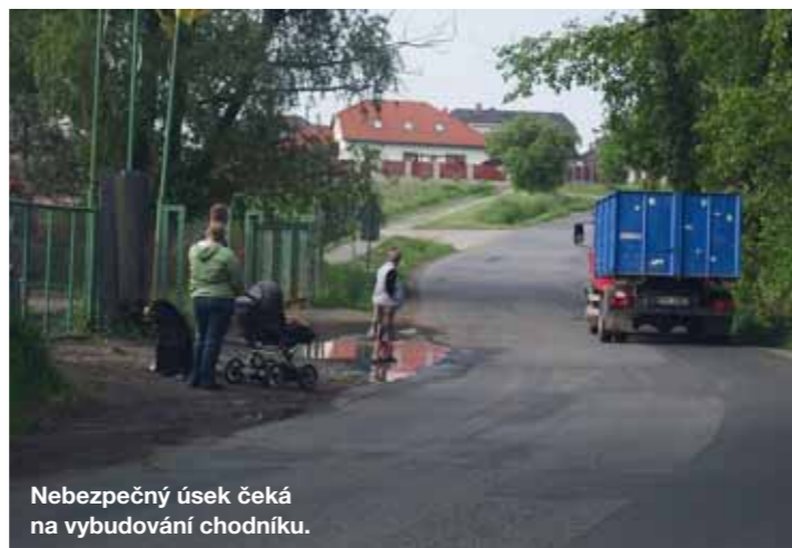
Nebezpečný úsek čekat na vybudování chodníku.