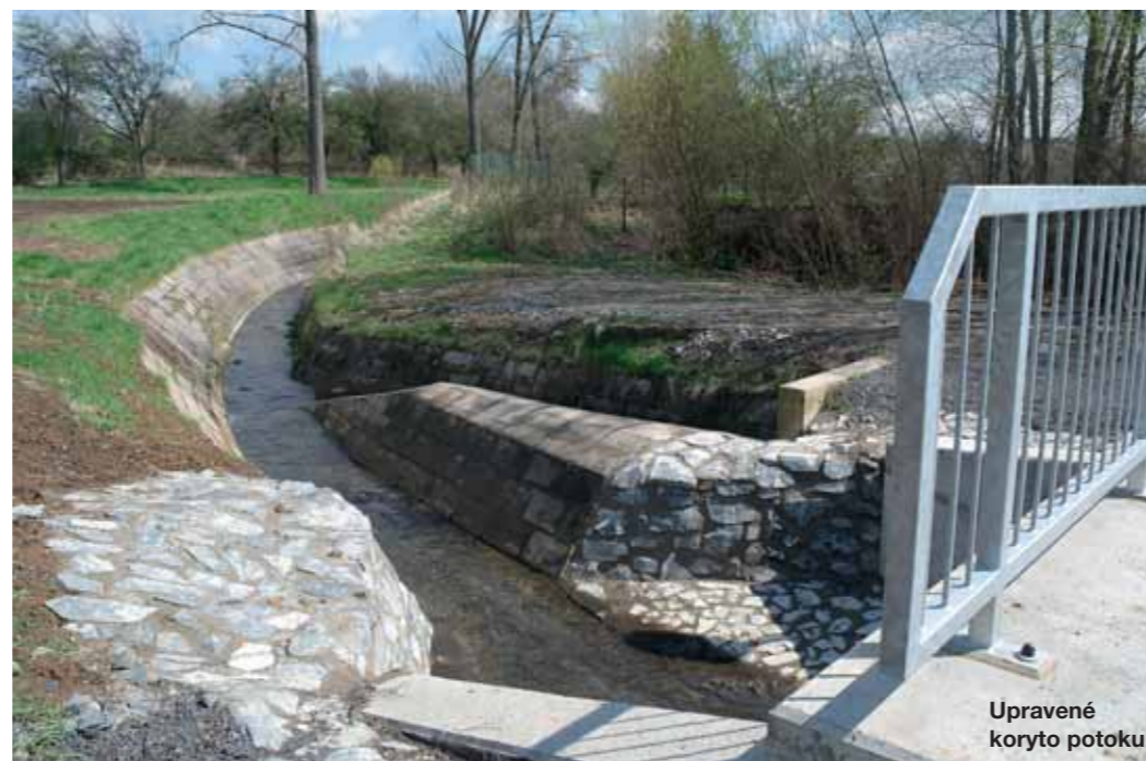
Upravené koryto potoka

Aktuálně obec dokončuje vycházkovou trasu s odpočívadly do lokality Dolnice, směrem k Rokytce.