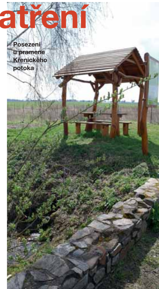
Posezení u pramene Křenického potoka

Obec pořádá různé společenské akce. Konalo se pálení čarodějnic, na červen chystáme Den dětí. V obci máme krásné fotbalové hřiště se zázemím, kde se kromě fotbalu konají další společenské akce, například 19. 5. se zde bude konat velká výstava služebního plemene boxerů. V obci dobře funguje kynologický klub, který má též své vlastní cvičiště pro psy. Čtenáře Zápraži bych rád pozval i na tradiční fotbalový turnaj o pohár Křenic, který se uskuteční 21. – 22. 7. Již nyní mohu slíbit, že kromě zdatných fotbalistů nastoupí i dvě statečná družstva žen z Křenic a Královic.