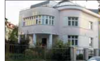
VILA PRAHA - KOBYLISY

Prodej luxusní vily 7+2 s terasou a dvojgaráží, na pozemku 400 m², po totální rekonstrukci. Cena: 35.000.000,- Kč 731 040 040