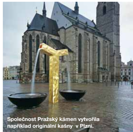
Společnost Pražský kámen vytvořila například originální kašny v Plzni.

CO VŠECHNO UMÍME: Obklady a dlažby z kamene, kuchyňské pracovní desky, vany a umyvadla z kamene, obložení krbů a římsy, kamenné parapety, zídky, chodníky, šlapáky do zahrady, lemy ke skalkám, a také pečící a grilovací kameny, schody. Podle vašeho přání zhotovíme i náhrobní kameny.