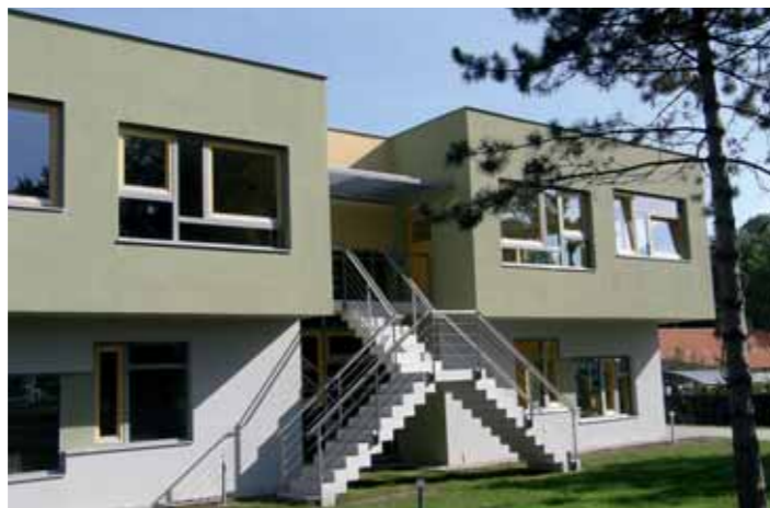
Kapacita mateřské školy v Uhříněvsi byla již čtyřikrát navyšována.

Problémy s velkým počtem dětí a nedostatečnou kapacitou školek a škol řeší většina obcí na Praze východ. Výjimkou není ani městská část Praha 22 – Uhříněves.