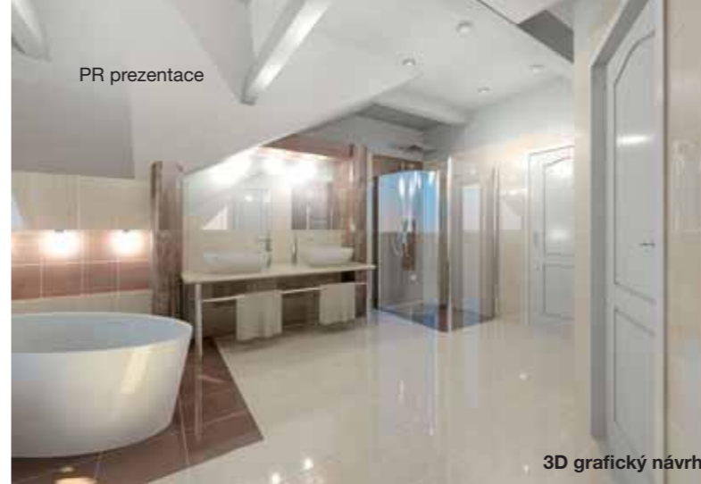
3D grafický návrh

Klientské centrum INVIA.CZ sídlí v Říčanech vedle pobočky Komerční banky v ul. 17. listopadu 51/1, tel.: 323 602 240 nebo bezplatná linka 800 555 333, e-mail: ricany@invia.cz www.invia.cz