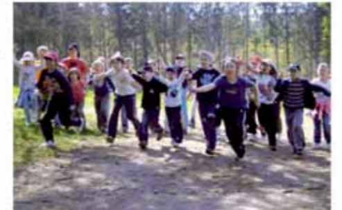
Základní škola s rozšířenou výukou jazyků Magic Hill s.r.o., Řičany, www.magic-hill.cz

tých 5 let a pokroky, které naši žáci učinili, vidím skupinku prvňáčků a jejich poněkud napnutých rodičů z toho, co je čeká v nové škole, co bude jinak a jak to všichni zvládneme. Dnes ale školu opouštějí žáci, kteří jsou sebevědomí, dokonale vládnu českým i anglickým jazykem, a to tak dobře, že obstáli i při zahraničních studijních pobytech v Anglii nebo USA. Školy ani učitelů se nebojí, mají v ně důvěru a chápou je jako osobnosti, které jim citlivě předávaly své znalosti a rozvíjeli v nich touhu po poznání a zájem o vše nové. Děti se také naučily vzájemnému respektu, své vrstevníky i mladší spolužáky vidí jako partnery, kterým mohou pomoci, ale na které se mohou také obrátit v případě potřeby. Přeji si, ale hlavně přeji našim absolventům, aby jejich cesta za dalším poznáním byla naplněna stejně, a aby roky, které strávili v naší škole, byly pro ně navždy těmi, na které budou rádi vzpomínat, a na kterých budou moci dále stavět.