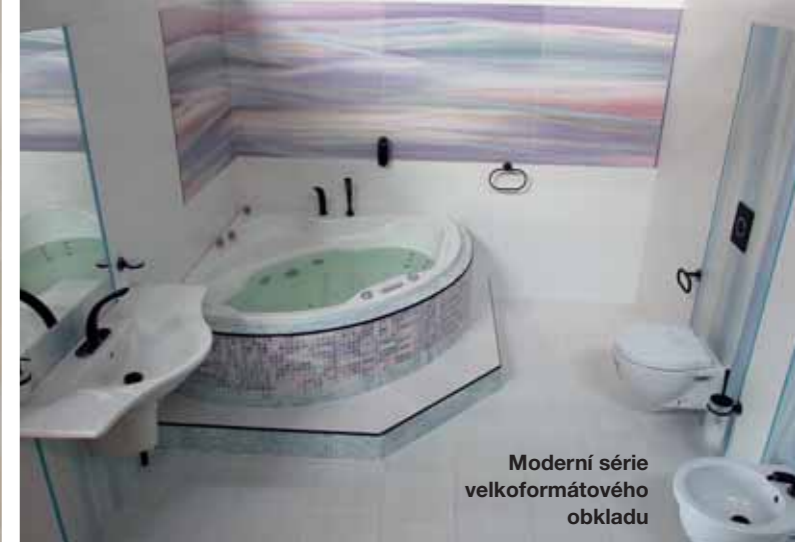
Moderní série velkoformátového obkladu