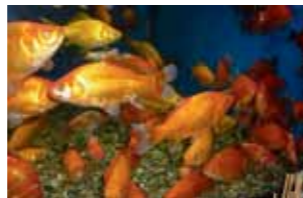
Zahradnictví Alfík najdete v Louňovicích u silnice Kutnohorská (na první hrázi). Otevírací doba: po-so: 9 až 17 hod., ne: 9 až 12 hod., tel.: 606 494 939, 723 516 513.