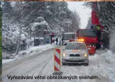
Vyřezávání větví obtěžkaných sněhem