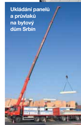
Ukládání panelů a průvlaků na bytový dům Srbin