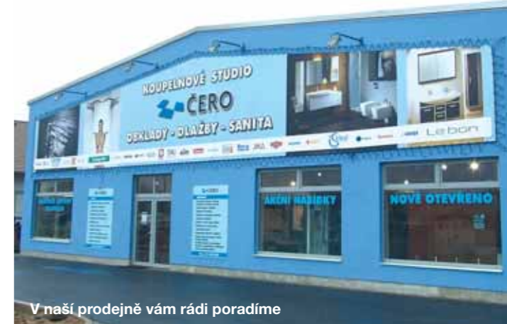
V naší prodejně vám rádi poradíme

Ano! Spolupracujeme s osvědčenými řemeslníky (obkladači, zedníci, instalatéři) a dokážeme koupelnu, popřípadě i úpravu celého bytového jádra dodat na klíč. Objednávky kompletujeme v našem skladu tak, aby byla zajištěna plynulá dodávka a návaznost na stavbě. Zákazníkovi odpadají starosti, kam zakoupit obklady či vanu uskladnit. Při montážích zajišťujeme stavební dozor a bezodkladně řešíme problémy stavby. Zajišťujeme také záruční i pozáruční servis námi prodávaných výrobků.