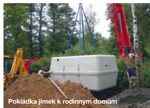
Pokládka jímek k rodinným domům

Postup při demolici – obhlídka terénu, dojednání termínu, zvážení postupu demolice. Demolice se provádí strojově (štipacími kleštěmi na beton a železo), bouráním zemním strojem, (pneumatickým kladivem nebo lžící na stroji CAT M313C nebo JCB4CX), ručně (provádí se tehdy, když si zákazník přeje odpad třídit (dřevo, suš....) Nakonec se odpad odveze na skládku naší nákladní technikou.