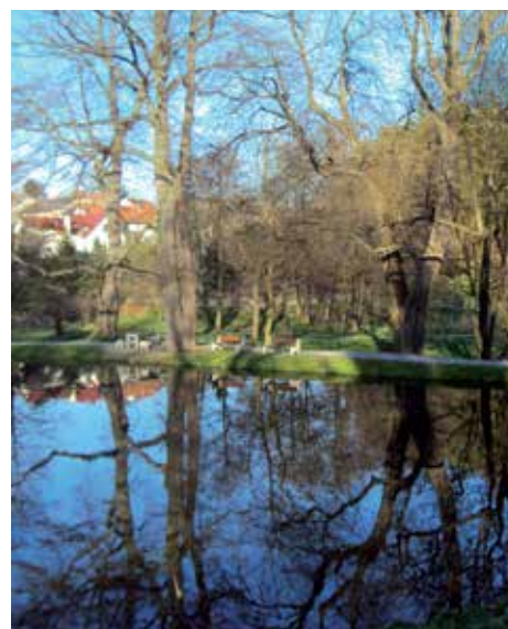
Romantické posezení na lavičkách v parku Daleška

Na obecní úřad nám chodí pozitivní děkované zprávy, tak doufáme, že se park líbí. Dřevěné sochy si oblíbilo snad každé dítě, a o to více, že jsou to „živá“ díla, kterých se můžete dotýkat a hrát si s nimi. Setkali jsme se i s názory, že jsou to zbytečně vynaložené peníze, že všechno zničí vandalové. Ale pokud bychom se nechali odradit, tak bychom nemohli udělat vůbec nic.