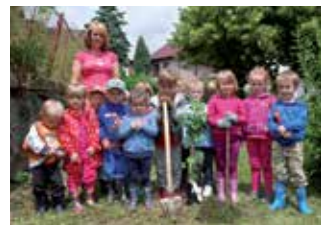
Výsadili jsme rybiž a příští rok budeme sklízet

Milé děti, prázdniny si krásně užijeme. Budeme se koupat v bazénu na naší nové bezpečné zahradě a také si vytvoříme keramické výrobky v zahradní peci u paní keramičky. Vypravíme se na výlety po okolí – vezmeme si s sebou buzolu a naučíme se orientovat v mapě. Světové strany jsme se již naučili. Také si zahrajeme na olympiádu a uspořádáme velké sportovní hry na hřišti.