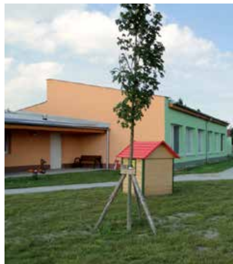
MŠ Sluníčko je pýchou Sulic

Musím podotknout, že výstavbu chodníků nepodmiňujeme opravou krajských komunikací, ale stavíme je bez ohledu na tyto opravy. Jde to. Během letních měsíců proběhne výstavba závěrečné části bezbariérových chodníků na Želivci. Výstavbou posledního úseku mezi obchodním domem TESCO a lokalitou Mandava v délce cca 275 m dojde nejen ke zlepšení bezpečnosti chodců, kte-