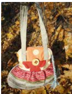
Marcela Graclíková (Kabelky a textilní doplňky)

Celkově byl certifikát prodloužen pěti ze sedmi výrobců. Dvěma výrobcům, kteří z osobních důvodů značku neprodlužují, děkujeme za spolupráci. Všem, co se značkou Zápraží pokračují, velmi blahopřejeme a držíme palce při dalším rozvoji podnikání. Více na http://www.regionalni-znacky.cz/zaprazi/