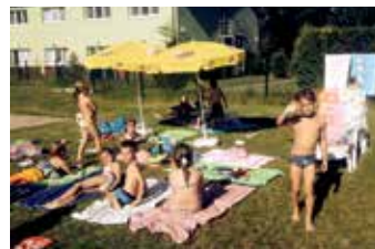
Výlet na Slapy jsme si užili