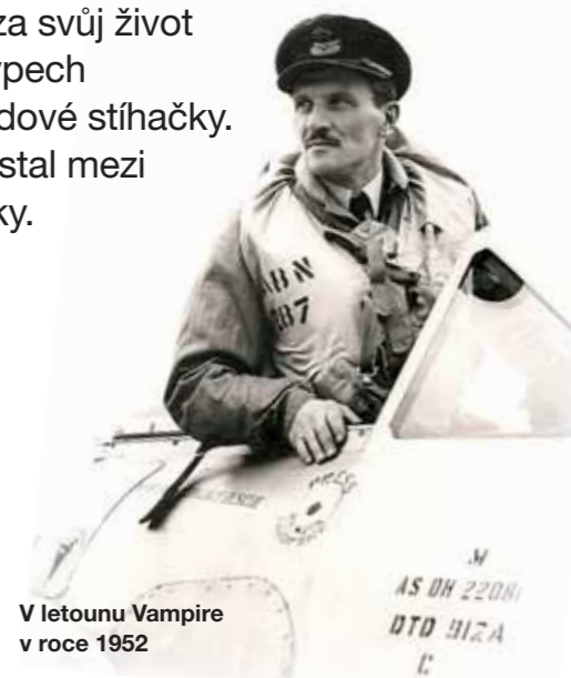
V letounu Vampire v roce 1952

Český válečný hrdina Raimund Půda nalétal za svůj život téměř 6 700 leteckých hodin na sedmdesáti typech letounů – od starých dvouplošníků až po proudové stíhačky. Poznal 52 zemí. S pěti sestřely nepřitele se dostal mezi československá stíhací esa druhé světové války.