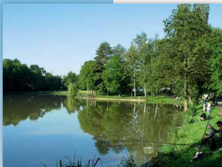
Postaví se u Marváneku domy nebo zůstane k rekreaci