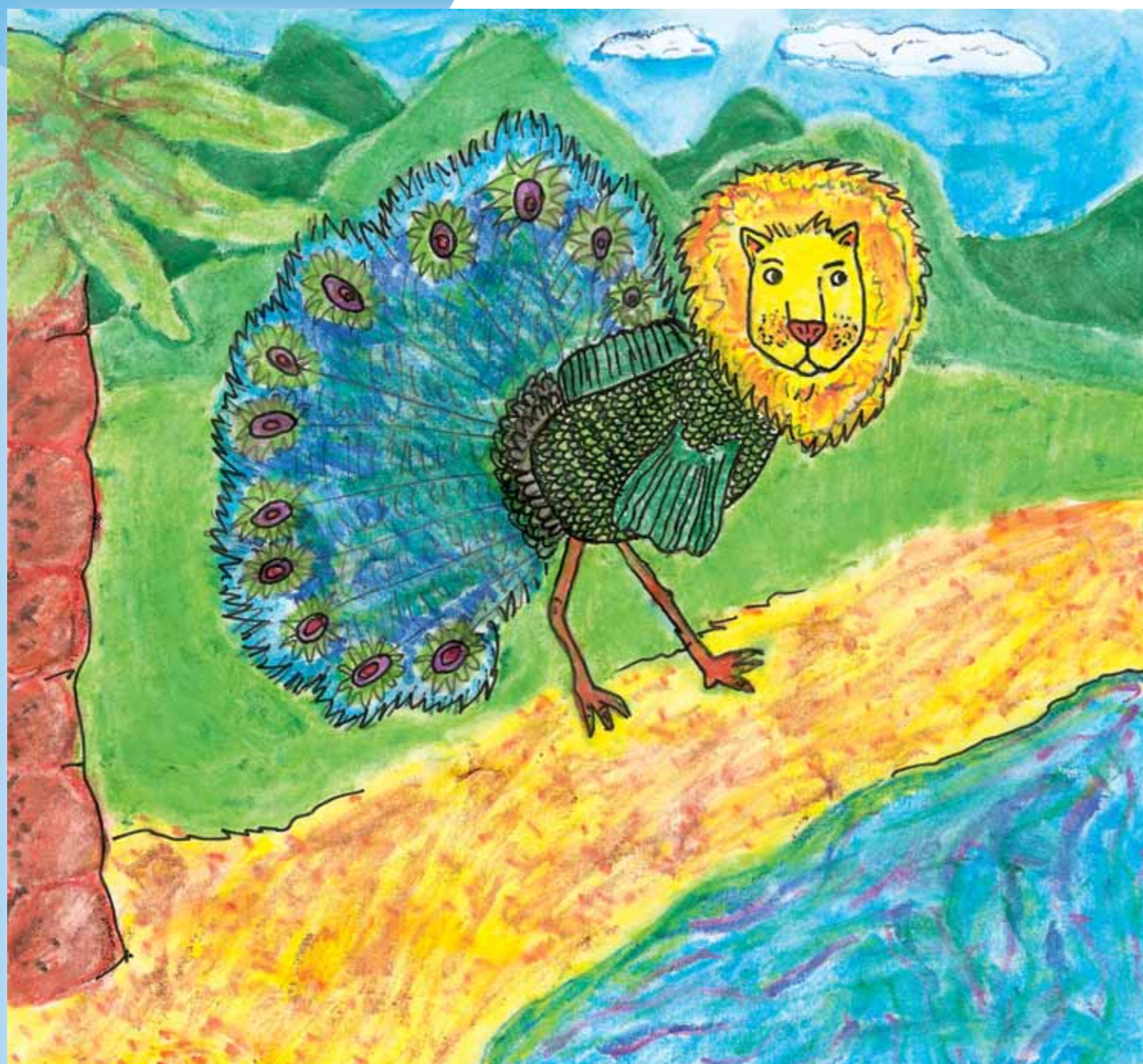
Ilustrace: Anna Fantová

Řešení pošlete na redakční adresu nebo na mail: redakce@zaprazi.eu . Nezapomeňte vést adresu.