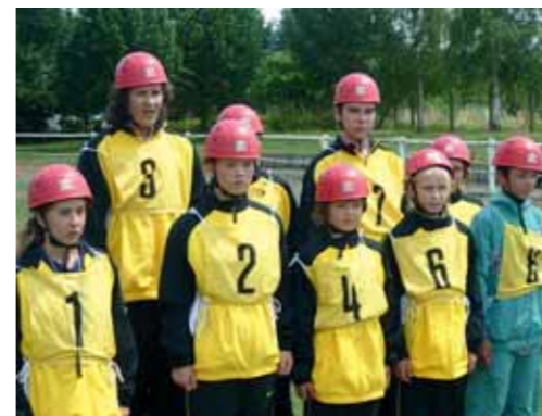
Mladí hasiči z Doubku nezklamali