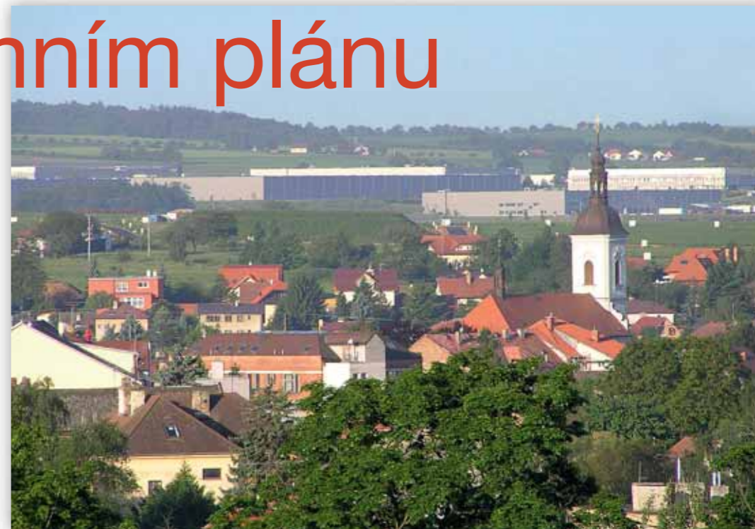
Říčany v zajetí logistických center

Město uspořádalo sérii pěti veřejných projednání, na kterých mohli lidé podávat své připomínky. Celkem se jich sešlo 240. Do návrhu se nakonec občanům podařilo prosadit – kupříkladu snížení regulativu výšky pro bytové domy z 15 na 12 metrů, což jsou čtyři patra oproti pěti. Mnohé další připomínky včetně petice na Komenského náměstí ale radnice nevzala v potaz.