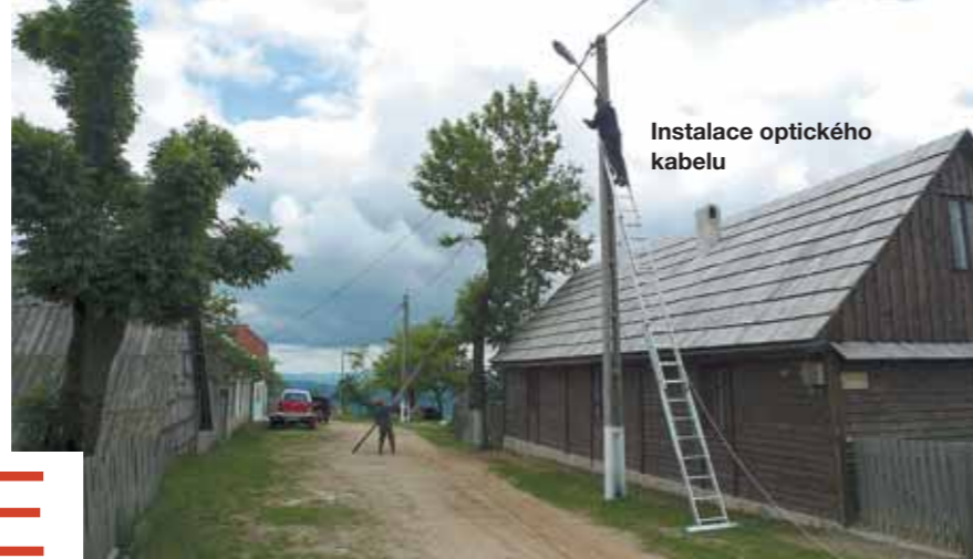
Instalace optického kabelu

Rovensko je česká vesnice v provincii Banát v Rumunsku. Češi na toto území přišli přibližně před 180 lety. Moc se o nich nevědělo, až do pádu totality, když se otevřely hranice a mohli svoji rodnou zem navštívit.