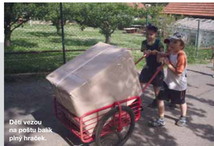
Děti vezou na poštu balík plný hraček.

A jak zní závěrečný „účet“ naší mise? Škola dostala čtyři repasované, ale více než vyhovující počítače. Instalovali jsme 300m optických kabelů a zprovoznil hlavní bezdrátový přístupový bod. V obci Rovensko jsme připojili prvních 15 uživatelů. A navíc – získali jsme další kontakty i z okolních obcí, kde potřebují pomoc. Od teď víme, že máme v tomto zapomenutém koutku Rumunska skvělé přátele a oni nás.“