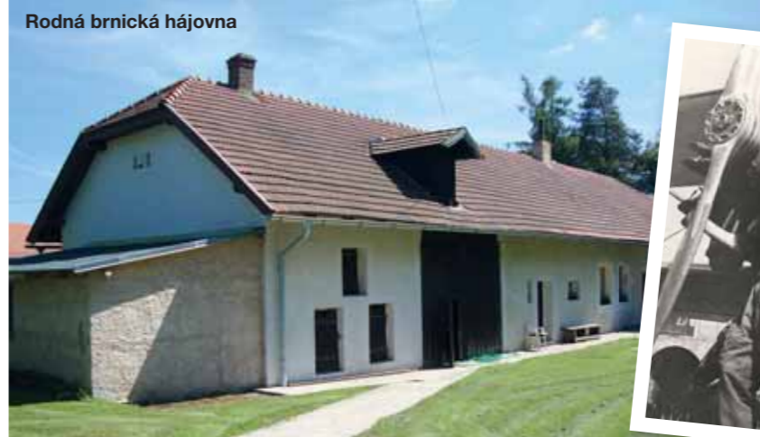
Rodná brnická hájovna