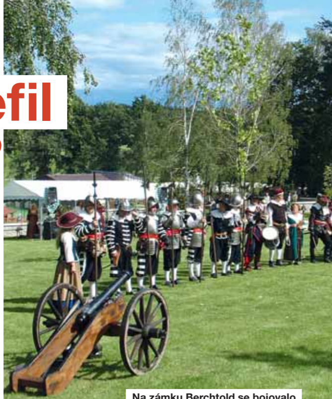
Na zámku Berchtold se bojovalo

Na zámku Berchtold v Kunicích-Vídovicích nezapomněli na děti ani o prázdninách a přichystali pro ně „Rytířské slavnosti“. Šermířské skupiny představily divákům nejruznější historicky doložené techniky ozbrojeného boje a také předvedly současnou sebeobranu. Děti se mohly zapojit do vybraných scének a akcí, či vyzkoušet své schopnosti v plnění „rytířských“ i jiných sportovních disciplín. Střílelo se z luku, bojovalo nad propastí, nebo házelo kopím na kance. Změřit síly mohli i dospěláci.