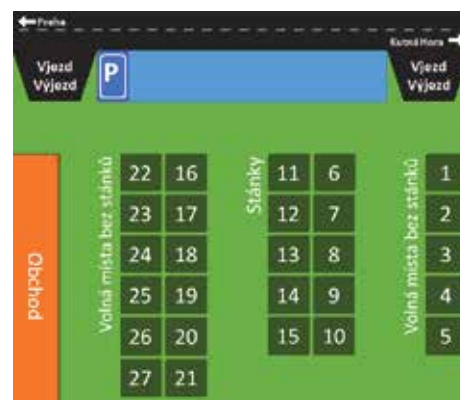
Plánek Farmářských trhů Mukařov