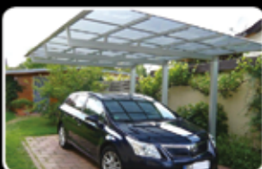
Přístřešek MLC5127 (5,1 x 2,7m)