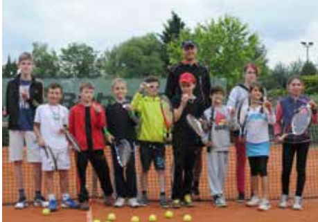
Letos v červnu tým mladších žáků TK Oáza Říčany dosáhl skvělého výsledku, když se umístil na prvním místě z deseti týmů v III. třídě soutěže smíšených družstev Českého tenisového svazu.

V moderním sportovním centru Oáza Říčany bude opět pokračovat oblíbená profesionální „zimní“ tenisová škola, a to v období od 13.10.2014 do 12.4.2015. Přihlašovat své děti můžete již nyní do 30. září 2014.