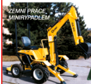
ZEMNÍ PRÁCE, MINIRYPADLEM