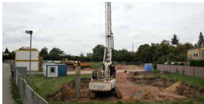
Výstavba nových bytových domů pokračuje bez komplikací.

„ Jak je to teda s tou Fialkou, budou domy napojeny na kanalizaci? “ ptají se mně často zájemci o bydlení Na Fialce a rád bych uvedl správná fakta. Výstavbu domů Na Fialce tvoří 6 bytových domů. V roce 2008 byl vydán stavební certifikát, na základě kterého jsou již postaveny tři domy pod označením A, E, D. Byty v těchto postavených domech jsou z 96% vyprodány, zbývá jenom pár volných bytů. Tyto domy a tím také byty, byly zkolaudovány v únoru 2012 a v té době se do nich nastěhovali první majitelé. Všechny postavené byty jsou připojeny na kanalizaci, která byla zkolaudována tak, aby se na ní daly připojit všechny byty, tj. i domy B,C,F, jejichž výstavba byla právě zahájena. To znamená, že máme zajištěnou dostatečnou kapacitu na připojení ke kanalizaci pro domy, které stavíme, protože takto byla kanalizace již zkolaudována a počítá se také s připojením k čistítku odpadních vod, v rámci rezervované, dosud volné kapacity.