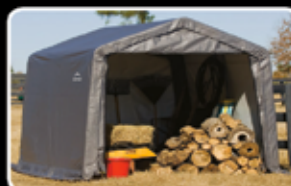
Kůlna 9m² (3x3m) Běžná cena 7.392,-