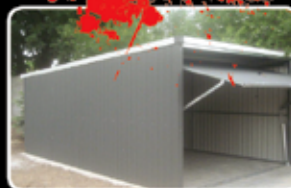
Eurogaráž výklopná vrata (3x5m) Běžná cena 25.250,-