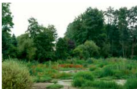
Zámecký rybník čeká na odbahnění