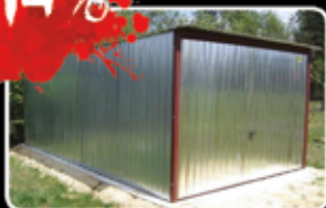
Pozinkovaná garáž (3x5m) Běžná cena 12.000,-