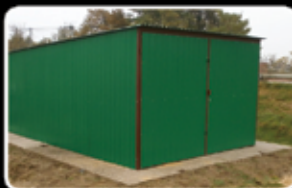
Garáž v barvě RAL (3x5m) Běžná cena 15.500,-