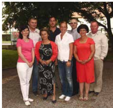
Sdružení nezávislých kandidátů „Naše Svojetice“