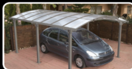
Hliníkový přístřešek Arcadia 6 sloupek (5m x 3,6m)