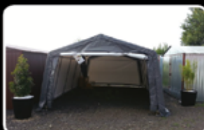
Kůlna 5,4m² (1,8x3m) Běžná cena 5.975,-