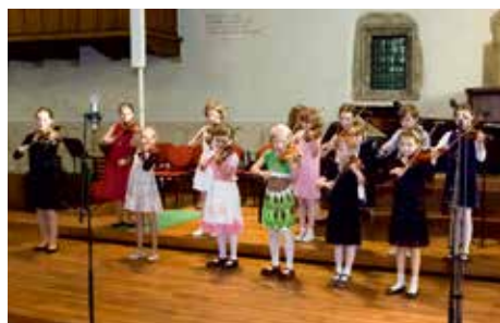
Houslový soubor v Betlémské kapli

ZUŠ v Říčanech má za sebou jeden z nejnáročnějších školních roků za posledních několik let. V roce 2013/2014 jsme uskutečnili zahraniční zájezd mladých muzikantů z Komorního orchestru do Itálie a zároveň přivítali italské hosty v České republice. Organizace celé akce byla velmi náročná, ale se zapojením rodičů a s pomocí všech žáků, pedagogů a zaměstnanců školy, jsme tuto akci ustáli na výbornou. Zároveň se od září loňského roku rozběhly oslavy 60. výročí založení umělecké školy v Říčanech. Uspořádali jsme celkem 11 koncertů a akcí, které byly významné nejen pro Říčansko, ale pro celý Středočeský kraj.