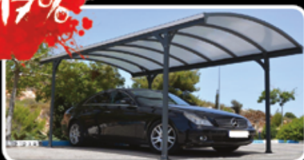
Hliníkový přístřešek Victoria 4 sloupky (5m x 3m)