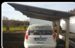
Přístřešek KS5127 (5,1m x 2,7m)