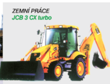
ZEMNÍ PRÁCE JCB 3 CX turbo