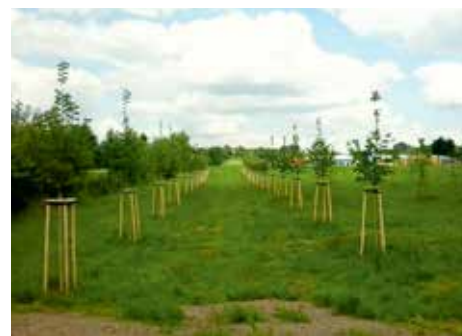
Park na Želivci – za každého nového občánka vysadí nový stromek.

„Možností se nabízí několik. Pokud by se obec Kamenice rozhodla vybudovat nástavbu či přístavbu školy a tím rozšířit kapacitu své školy, nebráníme se finanční spolupráci. Další možností je zřízení detašovaného pracoviště kamenické školy v těsné blízkosti naší mateřské školy na Želivci. V neposlední řadě můžeme též uvažovat o výstavbě vlastní školy. Zainvestovaný pozemek na Želivci máme připraven. Čekáme jen na závěrečné schválení územního plánu obce. Jde o krásnou lokalitu, která je pro vznik školy naprosto ideální. V sousedství již fungují dětská hřiště náležící k mateřské škole. Pozemek přímo navazuje na nově budovaný obecní park.“