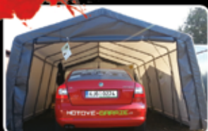
Garáž 18m² (3x6,1m) Běžná cena 9.856,-