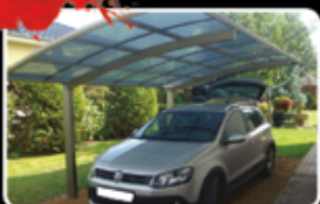
Přístřešek KC5127 (5,1 x 2,7m)