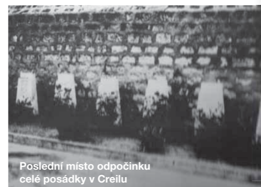
Poslední místo odpočinku celé posádky v Creilu