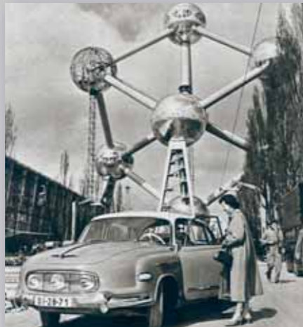
Československá vláda v roce 1959 rozhodla, že bude vítězství pavilónu přemístěn z Bruselu do Prahy na holešovické výstaviště (kde bohužel v roce 1991 vyhořel). Slavná restaurace Praha EXPO 58 přenesená do Letenských sadů zažila zejména v 60. letech éru velké slávy. Od roku 2000 však pouze chátrá. Nenašel se nikdo, kdo by se této, dnes již historicky cenné stavby včetně jejích skvostných interiérů ujal a vrátil jí její lesk a slávu.

Musíte znát, co lidi zajímá a zvolit správnou linku výstavního programu. To platí nejen u světové výstavy. Za své kariéry jsem udělal na sto výstav a nejrůznějších expozic. A pokaždé jsem si musel ujasnit, co lidé mohou znát a co ne. Jde o to, že se musíte dotknout toho, co je návštěvníkům blízké, aby je to zaujalo a expozice nenudila. Často bylo velice obtížné vysvětlit špičkovým vědcům, že některé detaily budou pro návštěvníky nezajímavé a složité. Oni se samozřejmě domnívali, že je důležité všechno a že nelze nic vypustit. A to byl právě můj úkol – tohle všechno zrežimovat a ustát. Abych tohle dokázal, musel jsem vždy danou tematiku pořádně nastudovat. Podobný pro-