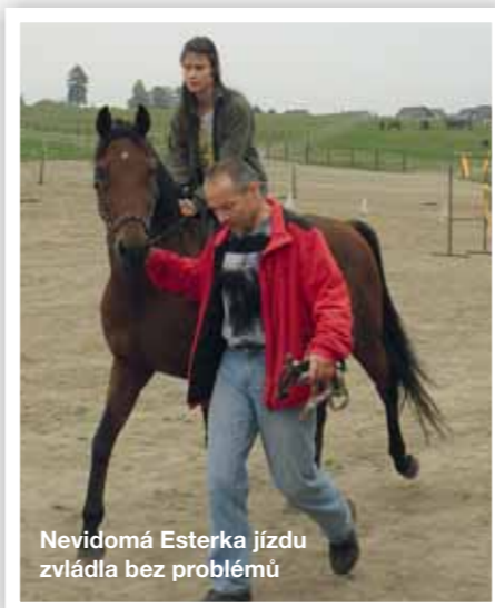
Nevidomá Esterka jízdu zvládla bez problémů