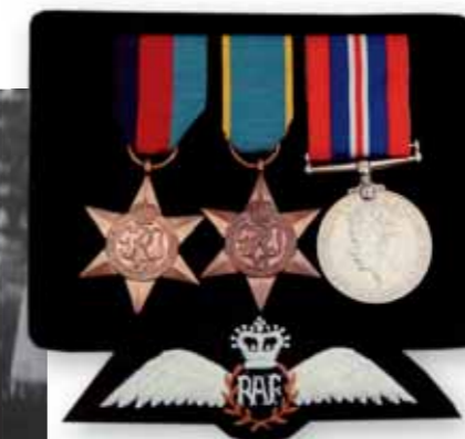
Pamětní medaile s pilotním odznakem RAF