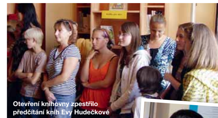
Otevření knihovny zpestřilo předčítání knih Evy Hudečkové

Slavnostního otevření se zúčastnili nejen žáci školy, ale i široká veřejnost. Patronkou knihovny se stala spisovatelka a herečka paní Eva Hudečková. Z jejích knih „Tajemství pražského šotka“ a „Sedmhlásek“ předčítaly dvě dívky z osmé třídy.