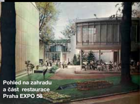
Pohled na zahradu a část restaurace Praha EXPO 58.

blém nastával i u umělců. Já si ve své koncepci vymyslel nějaký záměr a potřeboval jsem, aby se tomu malíř či sochař přizpůsobil. Někteří ale nechťeli pochopit, že to není jejich samostatná výstava, ale že jde o celek, v kterém má vše svůj řád a musí se přizpůsobit objednatelce. Samozřejmě jsme mohli diskutovat o detailech, ale koncepcí musela být zachována. No a v neposlední řadě je nejdůležitější najít špičky v daném oboru. Zkrátka ukázat opravdu to nejlepší! A to se nám v Bruselu bezesbýtku podařilo.