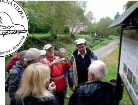
Vyprávění pana Zitty bylo zajímavé