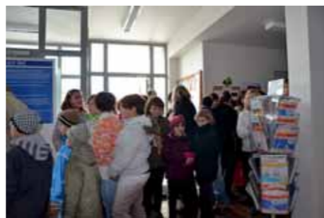
Dne sociálních služeb se zúčastnily i děti, které si mohly mimo jiné vyzkoušet, jak se jezdí na vozíku či pohybuje s chodítkem. Zjistily, že to není zdaleka tak jednoduché. Snad v nich tato zkušenost „probudí“ větší ohleduplnost ke zdravotně postiženým lidem.

Jednou z priorit, tedy přání občanů, bylo sestavení Adresáře sociálních služeb. Dosud byl přehled služeb vkládán do Uhríněveského zpravoda-