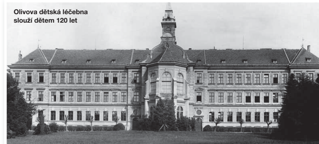
Olivova dětská léčebna slouží dětem 120 let

Tato petice bude předána na Magistrát hlavního města Prahy, k rukám primátora Prahy. Tímto prosíme všechny čtenáře Zápří o pomoc. Petici můžete podepsat v Městské knihovně na Masarykově náměstí, v Info-centru, na vrátnici v říčanské nemocnici, během soboty a čtvrtky k dispozici také na trzích na Masarykově náměstí v Říčanech. Bližší informace www.ricany.cz .