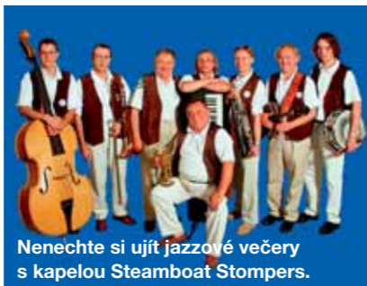
Nenechte si ujít jazzové večery s kapelou Steamboat Stompers.

Aktuální jídelní lístek, přehled kulturních akcí a možnost elektronické rezervace vstupenek najdete na www.klububoudu.cz , www.uboudu.cz , e-mail: restaurace@uboudu.cz , tel.: 776 150 060.