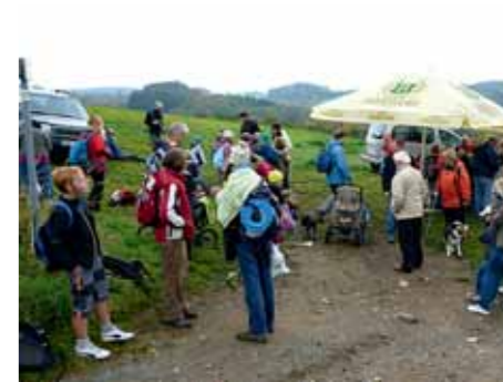
V Klokočné čekal na turisty čaj a výborné rizoto