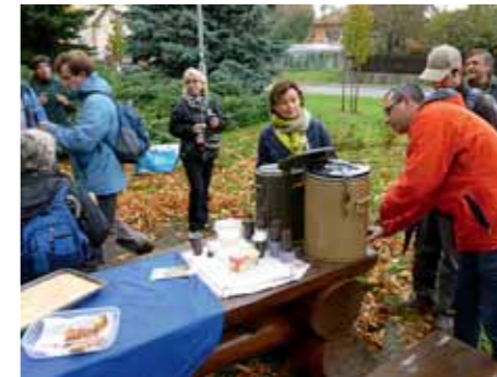
Ve Struhařově připravili občerstvení místní baráčníci