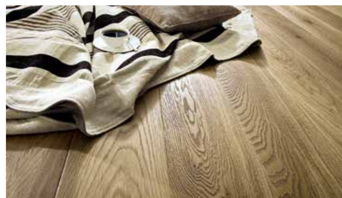
Dřevěná podlaha – to je klasika

Najdete nás hned vedle Billy v Říčanech na Černokostecké 1623/14, v budově bývalého Interiéru. Otevřeno Po-Pá 9.00-18.00 hod. Tel.: 604 941 123, www.noveinteriery.cz Bezproblémové parkování