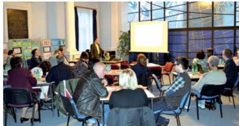
Autor: MAS Říčansko

Zároveň Plénem schválilo svůj jednací řád, změny v organizační struktuře MAS, změny ve statutu společnosti a v neposlední řadě volbu členů Programového výboru, Výběrové komise a Kontrolního výboru MAS. Jsme rádi, že účast na plénu byla velká, což je důkazem, že si partneři vědí, o jak zásadní krok se jedná.