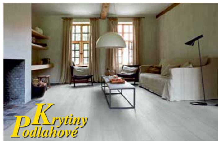
Vinylové podlahy jsou vhodné do každého interiéru

TOP MATERIÁLY MOŽNÁ PŘÁVĚ DO VAŠEHO NOVÉHO DOMU, BYTU, KANCELÁŘÍ.