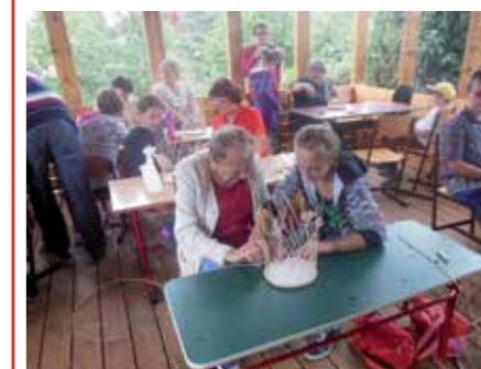
Venkovní učebna slouží všem obyvatelům Strančic.