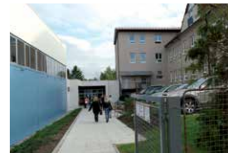
Vpravo je stará budova, vlevo nové křídlo s tělocvičnou.

Strančice – Přístavba základní školy ve Strančicích byla dokončena podle plánu a díky tomu mohli v září školáci usednout do nových tříd. Škola se rozrostla celkem o pět učeben (čtyři kmenové třídy a pátá bude sloužit jako počítačová a jazyková učebna) a také o novou tělocvičnu – ta původní musela být v minulosti kvůli nedostatku místa přebudována na učebny.