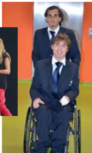
Pomoc handikepovanému spolužákovi je samozřejmostí.

společně vybereme tu nejhodnější univerzitu a studijní obor.