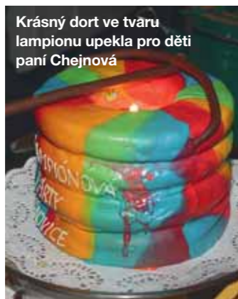
Krásný dort ve tvaru lampionu upekla pro děti paní Chejnová

Připojilo se kolem 80% obyvatel a příspěvek byl 10 000 Kč na vodovod a 20 000 Kč na kanalizaci, což je v okolí nejnižší částka.