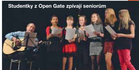
Studentky z Open Gate zpívají seniorům

Máme z toho velkou radost a úspěchy našich studentů bedlivě sledujeme. Na tom, že jsou naši studenti při přijímacích pohovorech úspěšní, má vliv i tzn. kariérní poradenství. V rámci něho se studenti probíráme jejich reálné možnosti a díky našim znalostem o vzdělávacích systémech v ČR i zahraničí,