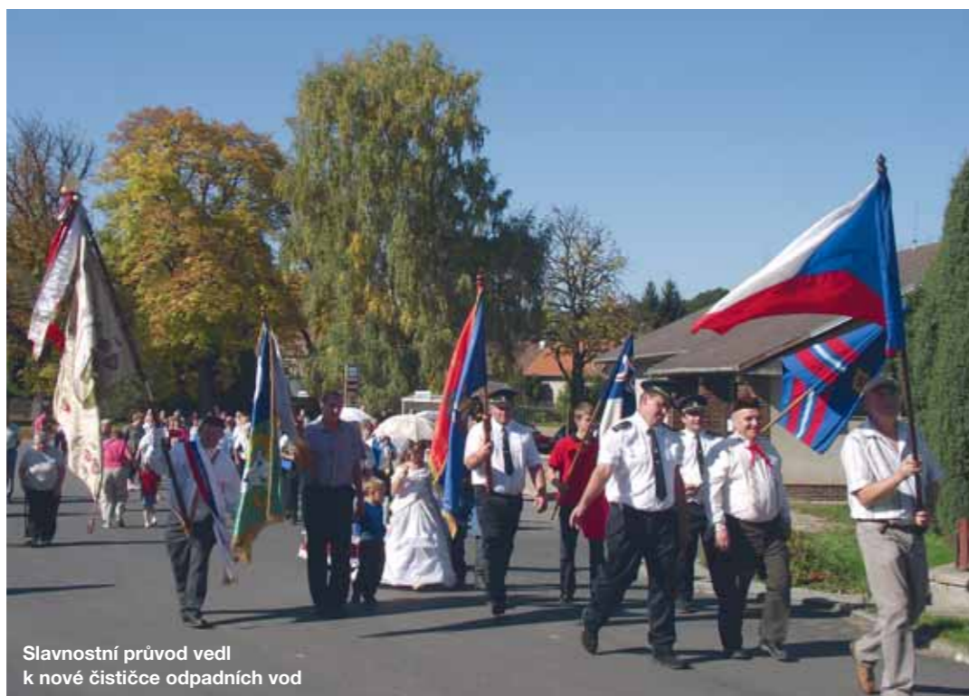
Slavnostní průvod vedl k nové čistírně odpadních vod

Vodovod stál necelých 20 milionů korun a dotace z Ministerstva zemědělství činila 65%, přičemž jsme měli ještě příslibeno 10% ze Středočeského kraje, ale bohužel jsme nedostali nic. Kanalizace se vyšplhala na 60 milionů a dotace činila 80%. Jelikož obec šetřila,