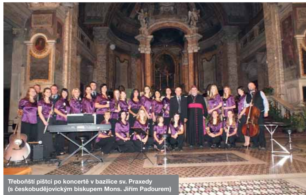
Třeboňští pištcí po koncertě v bazilice sv. Praxedy (s českobudějovickým biskupem Mons. Jiřím Paďourem)

Autocentrum Roškota-Janoušek s.r.o. Křenice 101 | 250 84 | tel. 323 605 313-6 | www.fiat-krenice.cz