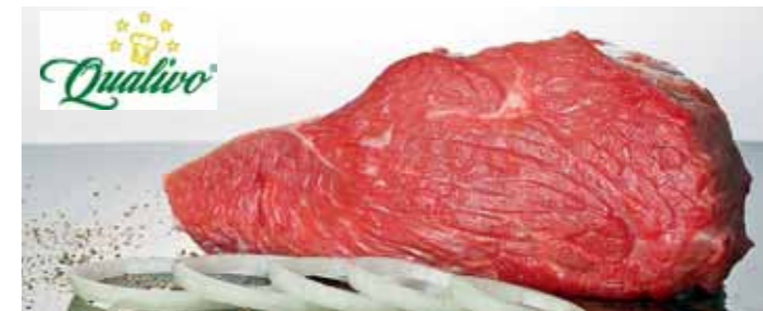
V restauraci Pavilon můžete ochutnat to nejkvalitnější hovězí.

Silvestr v klidu a pohodě Na Silvestra v Pavilonu nechystají žádné bujaré oslavy. Jestli máte chuť pochutnat si s přáteli v klidu na dobrém jídle a víně, určitě přijďte. Budou tu pro vás i po půlnoci.