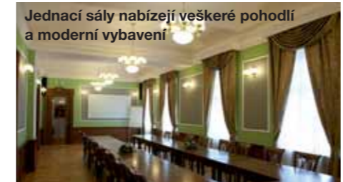
Jednací sály nabízejí veškeré pohodlí a moderní vybavení