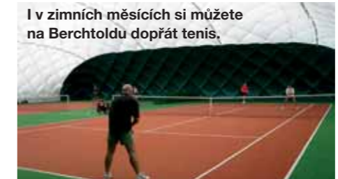
I v zimních měsících si můžete na Berchtoldu dopřát tenis.