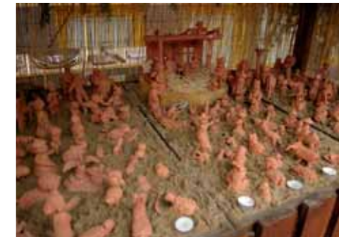
ZŠ nám. Bratří Jandusů tradičně uspořádala příjemnou předvánoční akci Rozsvícení betlému. Figurky do keramického betlému vytvářejí sami žáci a každý rok přibudou nové postavíčky.