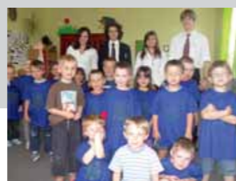
Studenti OG a jejich „žáčci“ z MŠ Mukařov

Objednat se můžete na tel.: 736 681 403 nebo jidloprodeti@seznam.cz , nebo navštívte poradnu ve SKC v Ondřejově (liché pondělí od 18 do 19 hod., každý čtvrtek od 19-20 hod.)