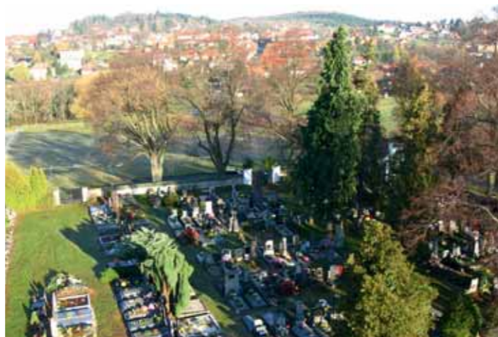
Hřbitov v Ondřejově se dočká digitálního zpracování.

Většina obcí nemá reálný aktuální plán hřbitovů a už vůbec ne v digitální podobě. My zajistíme přesné zakreslení hrobů včetně přesných rozměrů, fotodokumentaci, opíšeme údaje z náhrobků. Pomůžeme vyřešit nesrovnalosti v evidenci a doplníme seznam zesnulých o údaje, které nebyly pozůstalými řádně oznámeny. Odkaz pro zobrazení mapy lze umístit na oficiální webové stránky obce. Pracovník úřadu může snadno mapu upravovat, zadávat důležité informace pro veřejnost, vyznačit neuhrazené, či hroby k pronajmutí. Veřejné zobrazení aktualizované mapy ušetří pracovníky mnoha