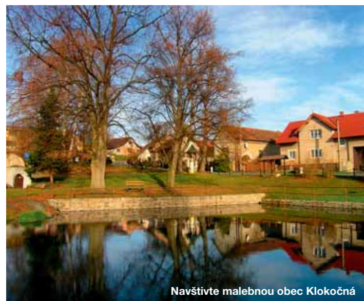
Navštivte malebnou obec Klokočná