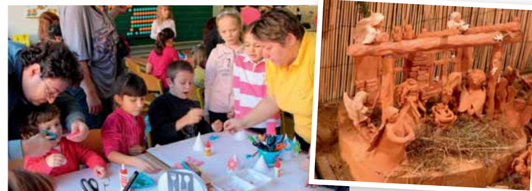
ZŠ nám. Bratří Jandusů tradičně uspořádala příjemnou předvánoční akci Rozsvícení betlému. Figurky do keramického betlému vytvářejí sami žáci a každý rok přibudou nové postavičky. Velký zájem je i o vánoční dílničky pro veřejnost.

■ V pondělí 16. prosince od 17 hodin vystoupí kroužky Domu Um na jevišti Divadla Bolka Polívky U22 s programem Vánoce, vánoce, přicházejí. Nebude chybět tombola o vánoční dárky.