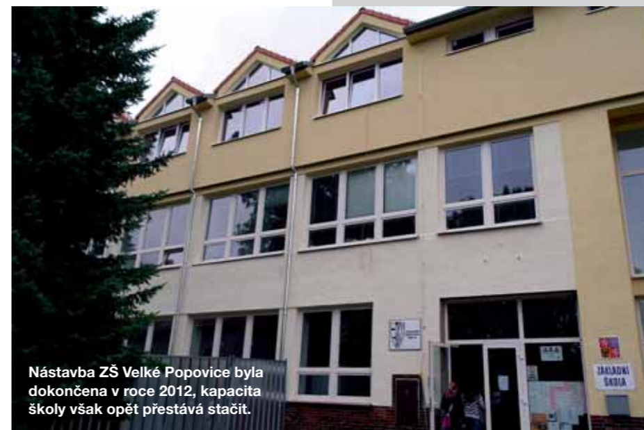
Nástavba ZŠ Velké Popovice byla dokončena v roce 2012, kapacita školy však opět přestává stačit.