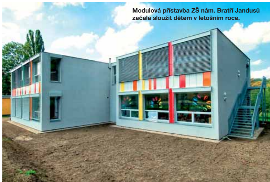
Modulová přístavba ZŠ nám. Bratří Jandusů začala sloužit dětem v letošním roce.

Řešení vidím v ITI projektech a ve vypracování strategických plánů, na kterých by spolu-