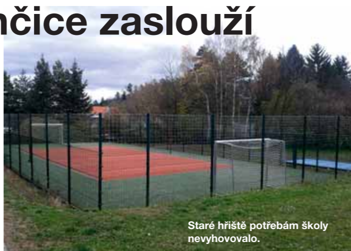
Staré hřiště potřebám školy nevyhovovalo.

Hřiště by se navíc mělo stát novým komunitním centrem pro setkávání obyvatel Strančic i okolních obcí. Obec nabídne hřiště za předem domluvených podmínek k využití široké veřejnosti, například tátové si mohou přijít o víkend zahrát nohejbal. Škola také plánuje pořádat turnaje pro okolní školy v přehazované, ve vybíjené, házené aj. Dále se zde mohou konat nejrůznější sportovní volnočasové kroužky.