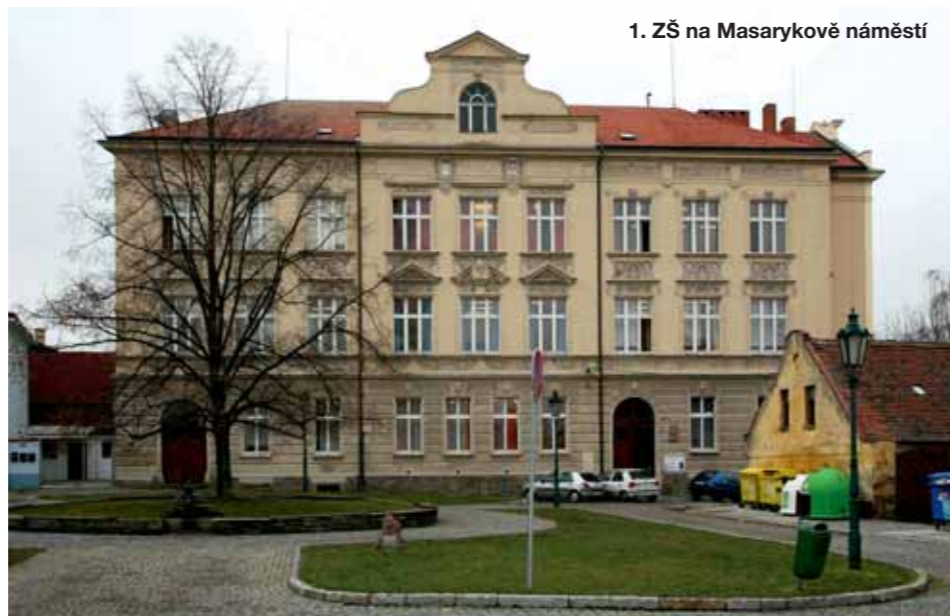
1. ZŠ na Masarykově náměstí

V Říčanech nastoupí podle odhadů příští rok do škol celkem cca 1858 žáků. Pro srovnání letos je to 1759, v roce 2007 to bylo 1206 (nyní 76 tříd, tehdy 55). Počet dětí s bydlištěm v Říčanech stoupl při porovnání s rokem