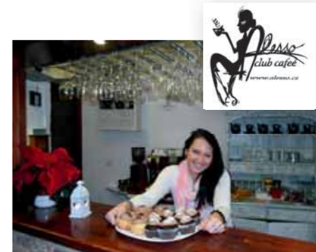
Otevřeno bude do 23. 12. a potom od 26. 12. Až půjdete po Vánocích na procházku, zastavte se u nás na kávu.

K dispozici je i salónek, který je vhodný pro privátní akce, jako jsou svatby a rodinné oslavy, nebo pro firemní večírky, jako jsou například nyní chystaná předvánoční posezení.