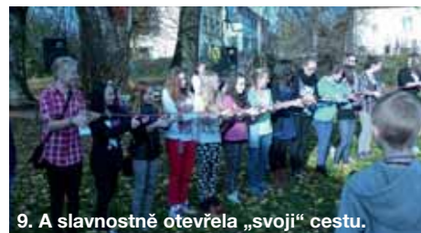
9. A slavnostně otevřela „svou“ cestu.

Evropský zemědělský fond pro rozvoj venkova. Evropa investuje do venkovských oblastí