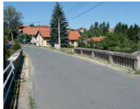
Mostek přes Kunický potok.

Ve výstavbě chodníků chceme pokračovat „V zajištění bezpečnosti chodců výstavbou chodníků podél krajských komunikací chceme samozřejmě pokračovat a tak jsme rádi, že jsme stihli do 6. ledna podat žádost na III. etapu. Předmětem této části bude nejen spojení I. a II. etapy (chodníky na Hlavní – II. třída s chodníky na Senohrabské), ale uprostřed stavby v koordinaci se Středočeským krajem rekonstrukce mostku přes Kunický potok, která bude vedle výměny celého svršku obsahovat i výstavbu dle uho toužebně očekávaného levostranného 1,5 m širokého chodníku! Od Krajské správy