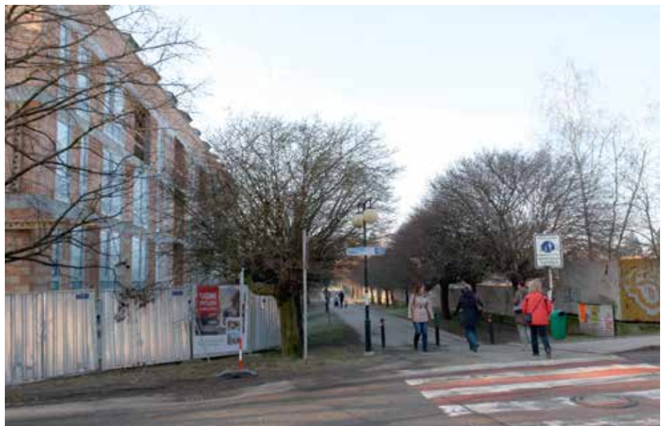
Co vyroste na sousedním pozemku, není zatím jasné.

Protože mi ji kladou s připomínkou, že jako majitel by naše společnost už měla mít jasno, těžko se dá vysvětlit, že tam nemůže být ani tolik žádané parkoviště. Když se naše společnost před 8 lety rozhodla koupit tento stavební pozemek, vynaložila za něj několik desítek milionů korun, za další nemalou částku nechala vypracovat projekt bytového domu s parkovištěm a úpravou okolí. V době přípravy změny územního plánu jsme vyjadřovali nesouhlas se změnou tohoto pozemku na nestavební a také