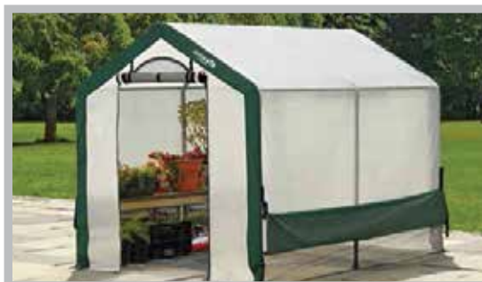
Fóliovník Fomal 3,24m 2 - 180 x 180 x 180 cm