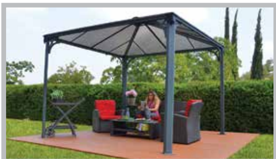
Hliníkový zahradní Altán Acamar 300x300 cm

Ukázkové centrum: ulice U Mototechny, 251 62 Tehovec, sjezd z hlavní silnice Golf Drive Tehovec