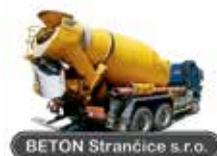
BETON Strančice s.r.o.

Výroba a čerpání betonu Prodej písků, drtí, kačírku Výstavba základových desek