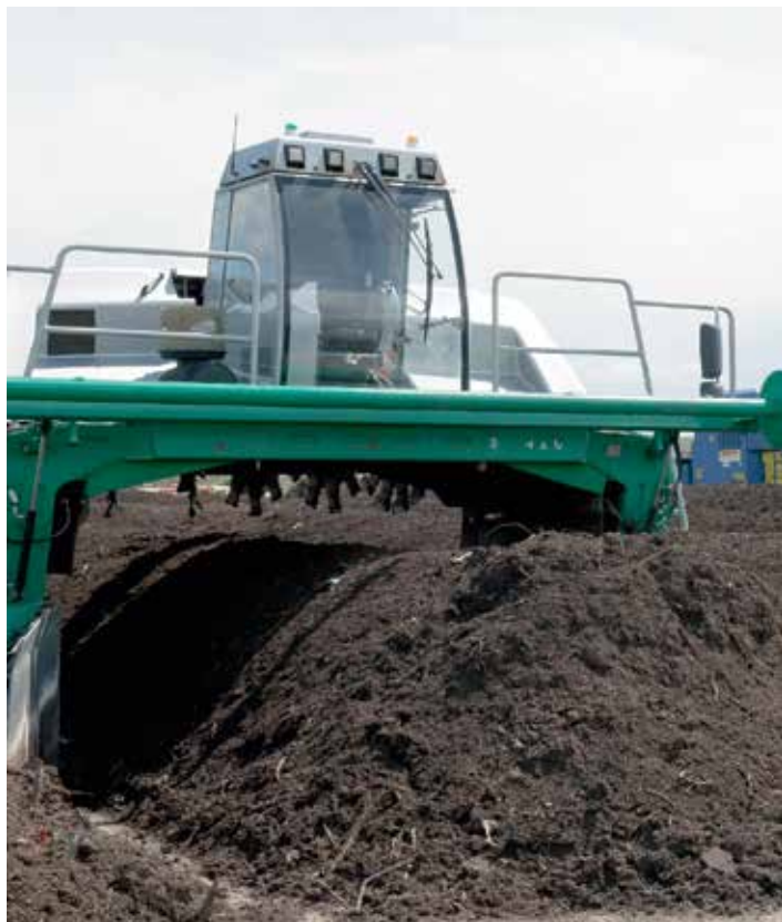
Překováváč prokysličuje zakládku kompostu.

Kompostárny v Čechách rostou jako houby po dešti a výjimkou není ani náš region. Kompostárny slouží k ekologické likvidaci biologicky rozložitelných odpadů (BRO), které tvoří velký podíl (až 2/3) v celkovém množství komunálního smíšeného odpadu. Snahou státu je tento podíl zmenšit a docílit toho, aby na skládky a do spaloven putovalo čím dál tím méně odpadu. Ostatně to České republice nařizují i směrnice EU.