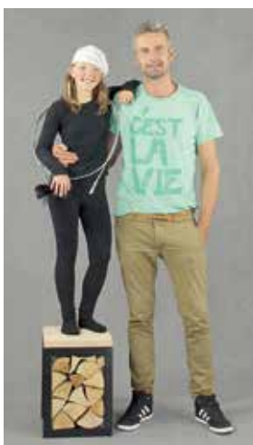
Herec Roman Zach fandí komíníkům z Říčan.

Pokud máte podezření, je komín poškozen, neváhejte a zavolejte nám. Přijedeme a vypracujeme vám nabídku řešení včetně cen ZDARMA.