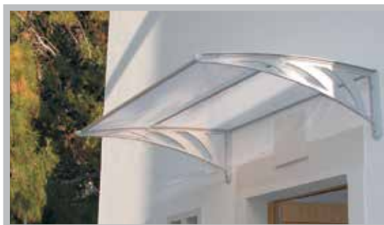
Vchodová stříška OneTrade standard 100x100cm