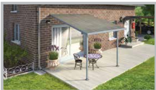
Hliníková pergola 300x300 cm