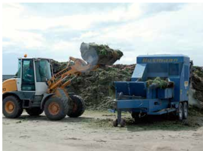
Přivezený bioodpad putuje nejdříve do drtičky.

Co se týče technologie – Jedna varianta je zpracování bioodpadu v řádcích, které jsou 1,5 metru vysoké. Což je hraniční velikost. Menší řádky rychleji vysychají a neudrží potřebnou teplotu. Větší zase nelze pořádně promíchávat a okysličovat. Je výhodnější mít více zakládek (řádků), které můžete upravovat tak, aby kompost dozrával postupně. V těchto řádcích lze také bezpečně zpracovávat kaly z ČOV.